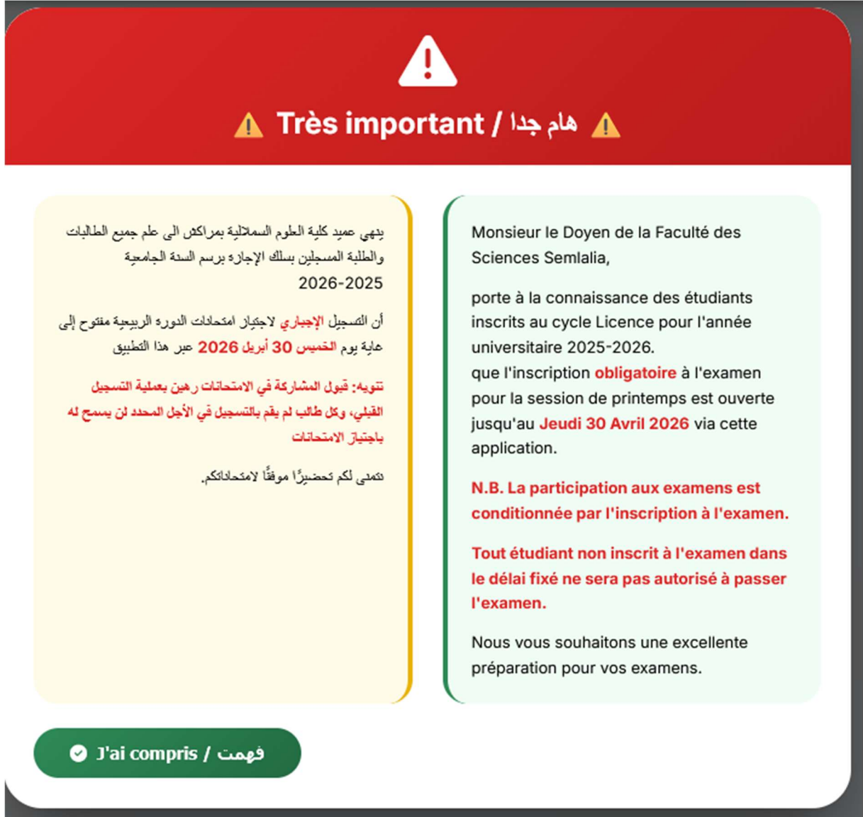
Figure 1: La page affiche un message d'alerte bilingue (français/arabe) informant les étudiants de l'inscription obligatoire aux examens de la session de printemps 2025-2026, avec une date limite .